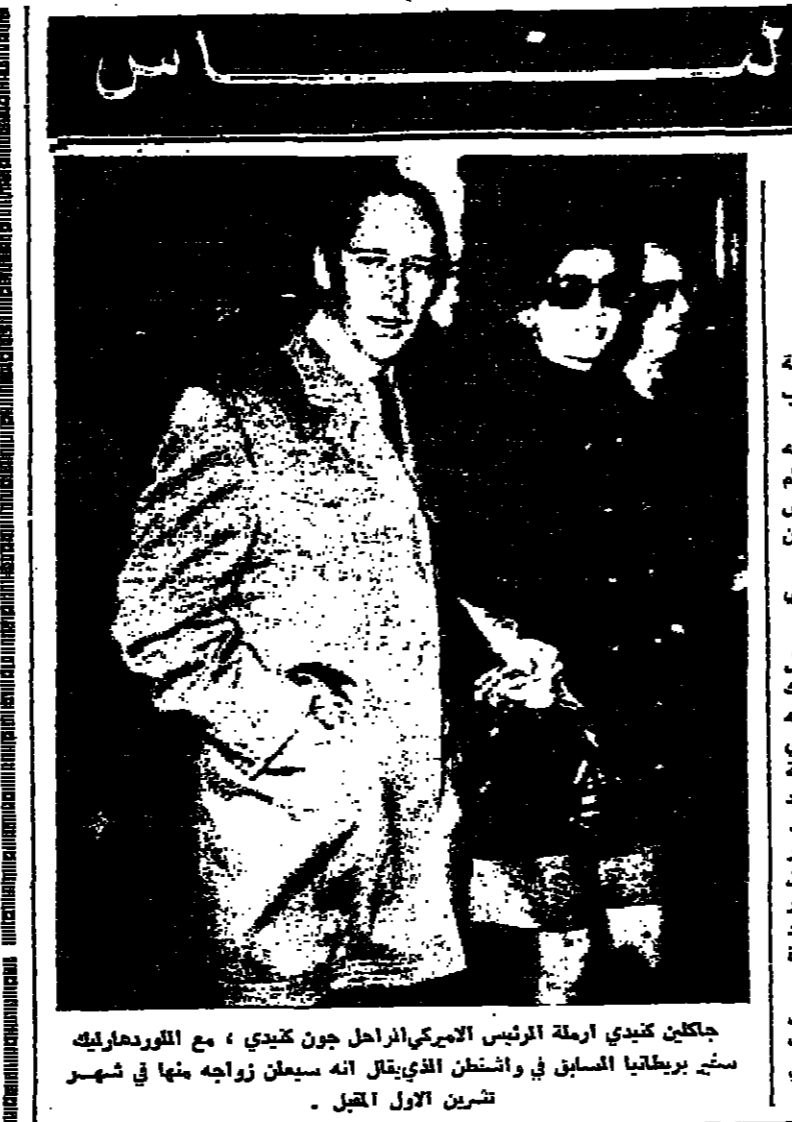
جككين كندي ارملة الرئيس الامريكى الراحل جون كينيدي ، مع اللورد هارليك ستر بريطانيا السابق في واشنطن الذي يقال انه سيعان زواجه منها في شهر تشرين الاول الجبل

من ولاية جورجيا أمس الأول والكثور ديني راند في عملية زرع الصمامات الاصطناعية وكان قد صرح اصرا بأنه يعتقد ان عمليات زرع الصمامات الاصطناعية لا تزال سبقة لانها وكان قد زرع صمام اصطناعي في قلبه واستمر في حياة خمس سنوات وابلغ اوستن بولاية كارولينا الشمالية وابعد ان باستطاعته ان يتزوج ابتداء في حياته يصل الى حوالي خمس سنوات . وجاء المستر ريجستر الى هنا قبل ١١ يوما معتقدا ان عملية زرع قلب بشري في صدره قد تنقذ حياته وقال ناطق باسم المستشفى الذي اجريت له فيه العملية الجراحية ان حالته حسنة بقدر ما يمكن توقعه ..